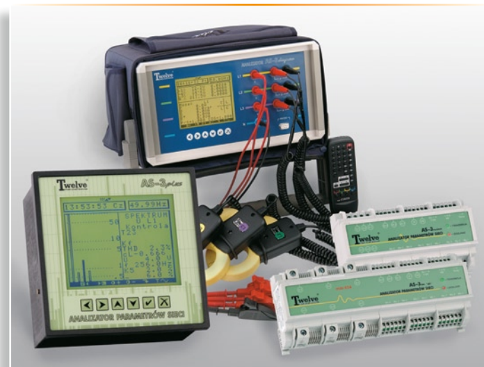
Rodzina analizatorów AS-3

ekranu (160 x 128 pikseli) są tak duże jak wymiar całej płyty czołowej większości oferowanych przez firmy konkurencyjne analizatorów (te o wymiarze 96 x 96 mm). Wyświetlacz ten pozwala na czytelne i precyzyjne pokazanie wszystkich rejestrowanych przez analizator parametrów, łącznie ze słupkowym wykresem zawartości poszczególnych wyższych harmonicznych w prądzie lub w napięciu. Pokazanie popularnej „gwiazdki” umożliwia graficzną kontrolę prawidłowości podłączenia do analizatora mierzonych napięć i prądów oraz ich skojarzenie, co do faz i kierunku wirowania. Na wyświetlaczu możemy obejrzeć też efekty funkcjonalności, dostępnej tylko w analizatorach z najwyższej półki, czyli przebiegi oscylograficzne rejestrowane przez funkcje oscyloskopu z pretriggerem, obrazujące kształty napięć i prądów np. w czasie awarii. Funkcja ta rozszerza funkcjonalność analizatora o prowadzenie diagnostyki, co umożliwia służbom energetycznym znalezienie bezpośrednich przyczyn awarii. Wbudowany w analizator